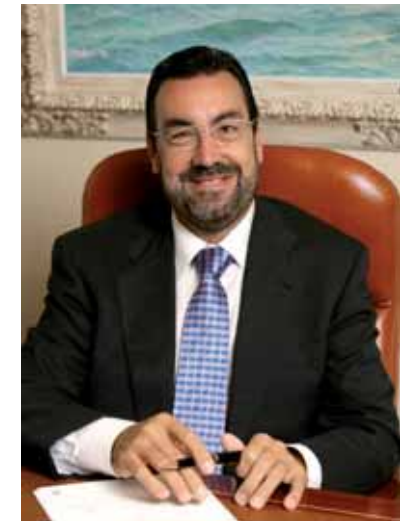
MIGUEL CARBALLEDA Presidente del Comité Paralímpico Español

Para lograr estos objetivos contamos de nuevo con unos inigualables compañeros de viaje, como son los patrocinadores del Plan ADOP, con quienes formamos la gran familia paralímpica. Juntos podemos.