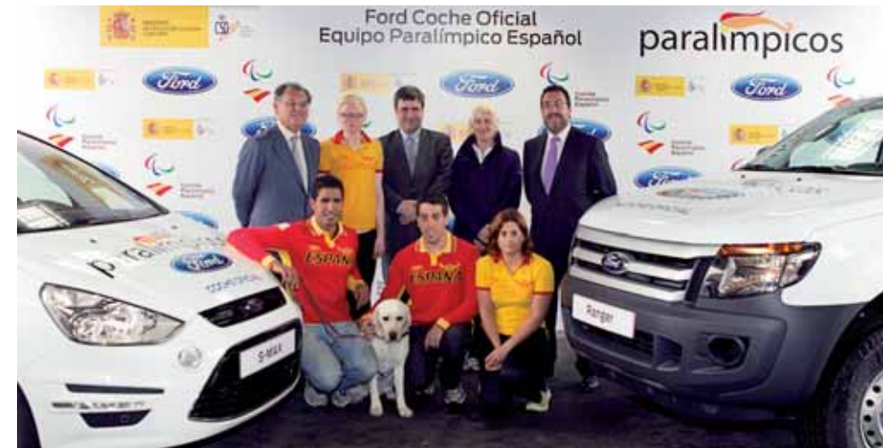
Día de la firma del acuerdo con el que Ford se convirtió en Coche Oficial del Equipo Paralímpico Español.

con Discapacidad Intelectual (FEDDI), que regresaba a los Juegos tras no asistir en las dos últimas ediciones, así como las Reales Federaciones Españolas de Ciclismo (RFEC), Tenis de Mesa (RFETM) y Vela (RFEV), estas últimas como consecuencia del citado proceso de integración de los deportes de personas con discapacidad en las federaciones deportivas españolas.