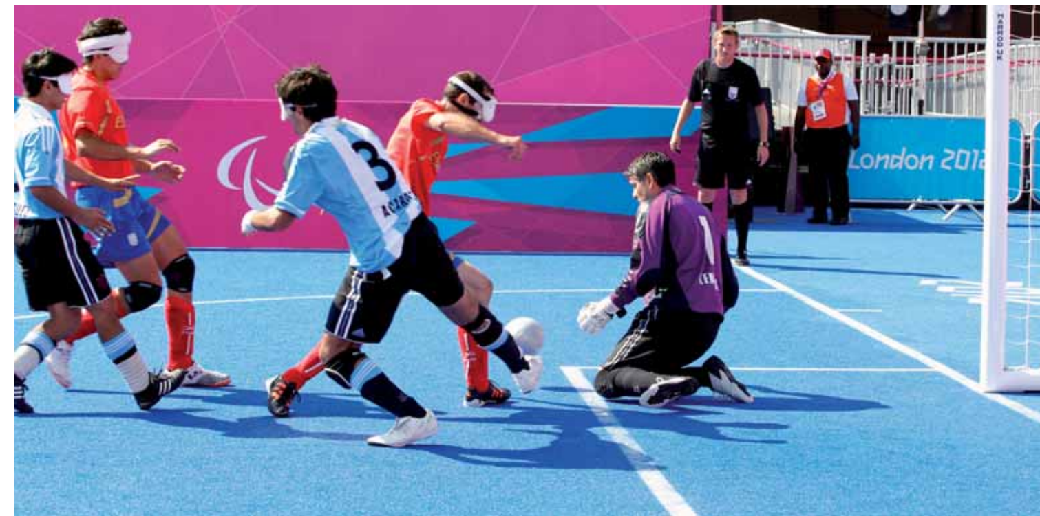
Un momento del partido por la medalla de bronce entre España y Argentina.

del descanso. Posteriormente, derrotó a Irán por 2-0, con dos tantos de Martín, y empató a cero contra Argentina. De esta forma, acabó primera en su grupo previo y accedió a las