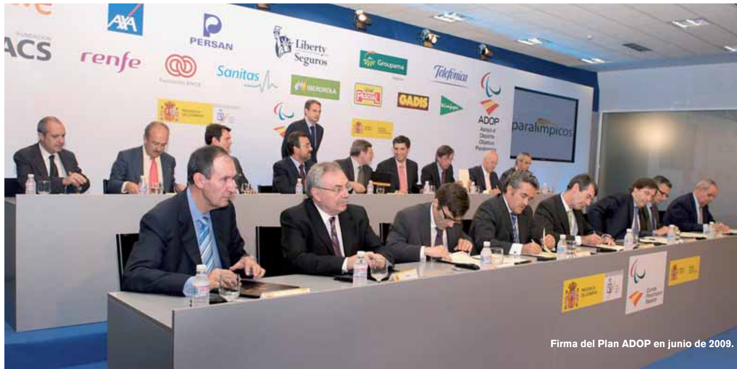
Firma del Plan ADOP en junio de 2009.

De hecho, en los Juegos de Londres fueron ocho las Federaciones Deportivas Españolas que aportaron deportistas al Equipo Paralímpico. A las cuatro que ya lo hicieron en Pekín 2008 –las de Ciegos (FEDC), Personas con Discapacidad Física (FEDDF), Personas con Parálisis Cerebral (FEDPC) y Remo (FER)– se unieron la de Personas