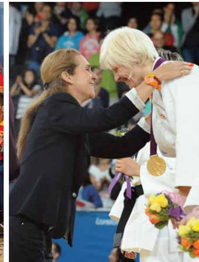
La Infanta Doña Elena entrega la medalla de oro a la judoka Carmen Herrera.

ONCE, Unidental y Radio Televisión Española. Los directivos de Iberdrola en Bilbao, Persán en Sevilla, Cofidis en Barcelona y Gadis en La Coruña también recibieron la gratitud del Equipo Paralímpico. Las recepciones oficiales que se llevaron a cabo en las sedes de los dos ministerios