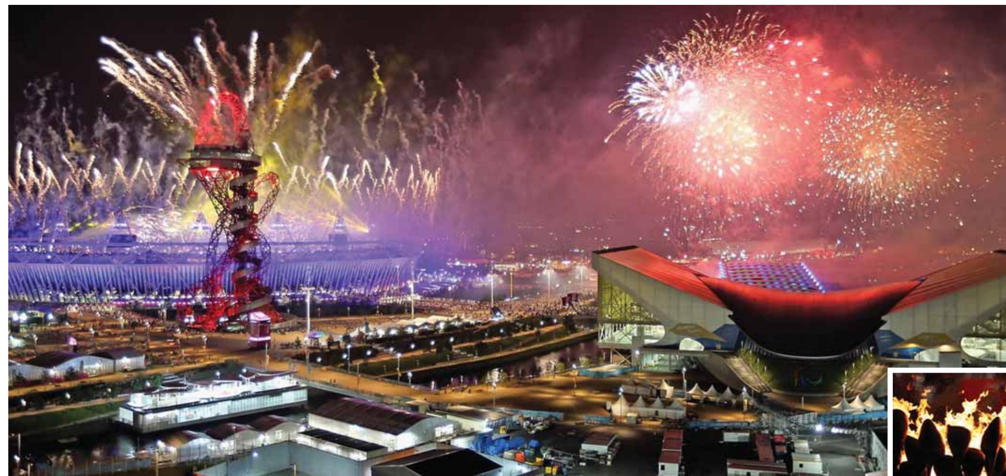
Los fuegos artificiales iluminan el Parque Olímpico en la ceremonia de clausura de los Juegos Paralímpicos.

Londres 2012 registró una participación histórica de 164 países, 17 más que en Pekín 2008. De ellos, 16 se estrenaron en unos Juegos Paralímpicos: Andorra, Albania, Antigua y Barbuda, Brunei, Camerún, Comoros, Corea del Norte, Gambia, Guinea Bissau, Islas Salomón, Islas Vírgenes de los Estados Unidos, Liberia, Mozambique, San Marino, República Democrática del Congo y Yibuti. Además, cinco delegaciones consiguieron medalla por primera vez: Chile, Etiopía, Fiji, Sri Lanka y Uzbekistán. El programa deportivo de estos Juegos fue el mismo que el de Pekín 2008, con