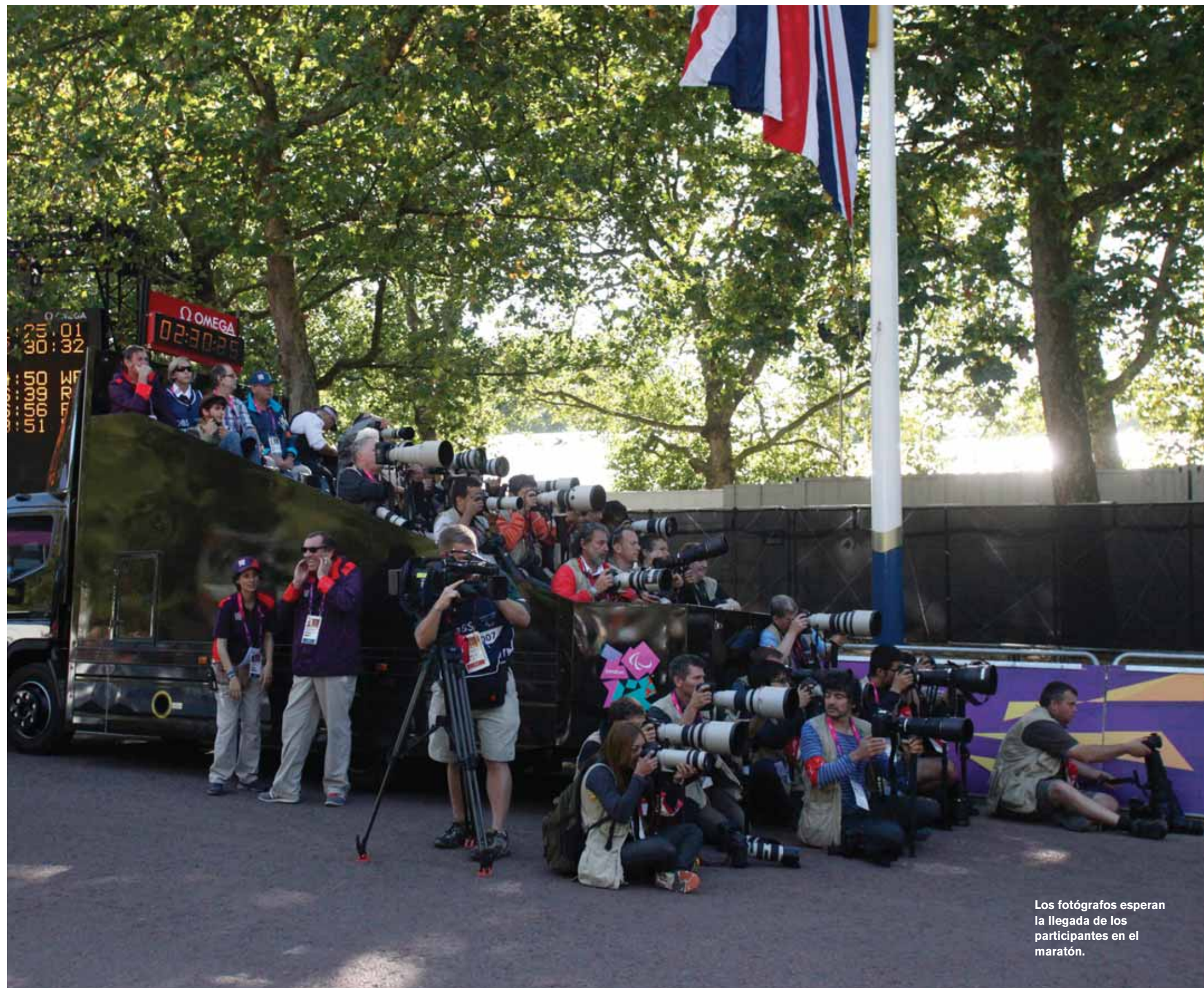
Los fotógrafos esperan la llegada de los participantes en el maratón.