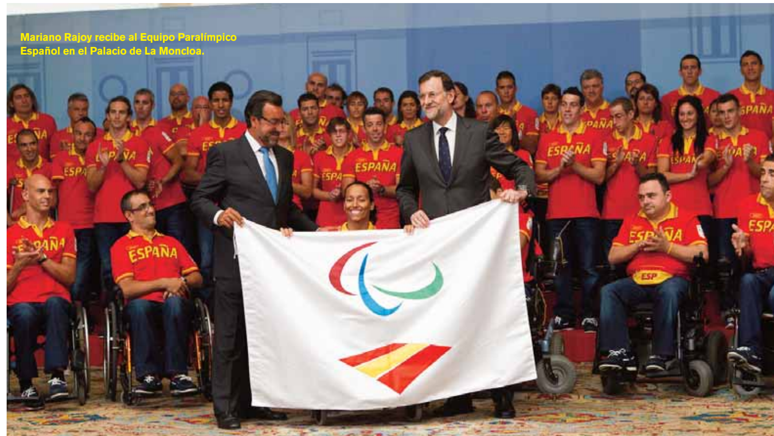
Mariano Rajoy recibe al Equipo Paralímpico Español en el Palacio de La Moncloa.

El Equipo Español también recibió la visita de dos ministros, el titular de Educación