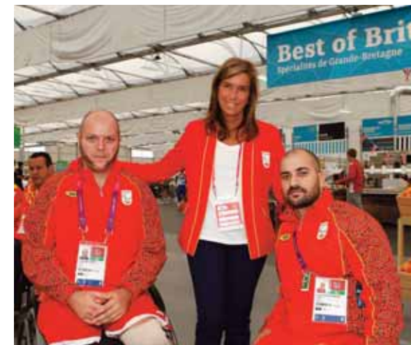
A la izquierda, Ana Mato con deportistas españoles en la Villa Paralímpica. En la imagen de la derecha, José Ignacio Wert, con vestimenta roja, junto a Miguel Cardenal y César Carlavilla, jefe del Equipo Paralímpico Español.

Ya de regreso en España con las 42 medallas logradas, multitud de instituciones públicas y privadas ofrecieron recibimientos a los deportistas paralímpicos. El primero de ellos tuvo lugar en el Aeropuerto de Barajas, nada más aterrizar, donde medio millar de personas esperaban la llegada de las grandes estrellas paralímpicas. Durante los siguientes días, los miembros de la expedición visitaron las sedes de las