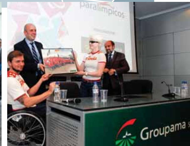
PLUS ULTRA SEGUROS