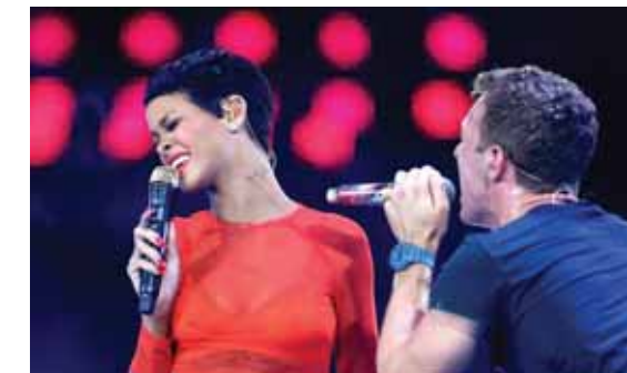
Rihanna y Chris Martin, cantante de Coldplay, cantan a dúo en la ceremonia de clausura.

portivas fueron las tres Villas Paralímpicas, el hotel de la Familia Paralímpica y el Centro Internacional de Prensa y Radiodifusión.