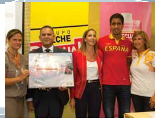
GRUPO LECHE PASCUAL