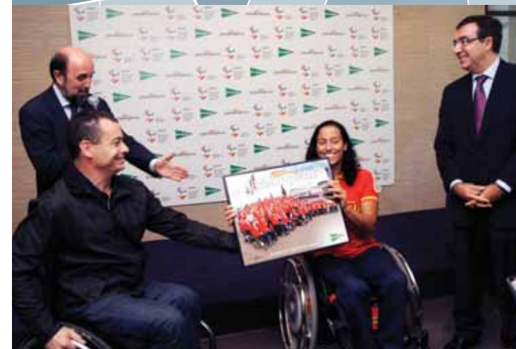
EL CORTE INGLÉS