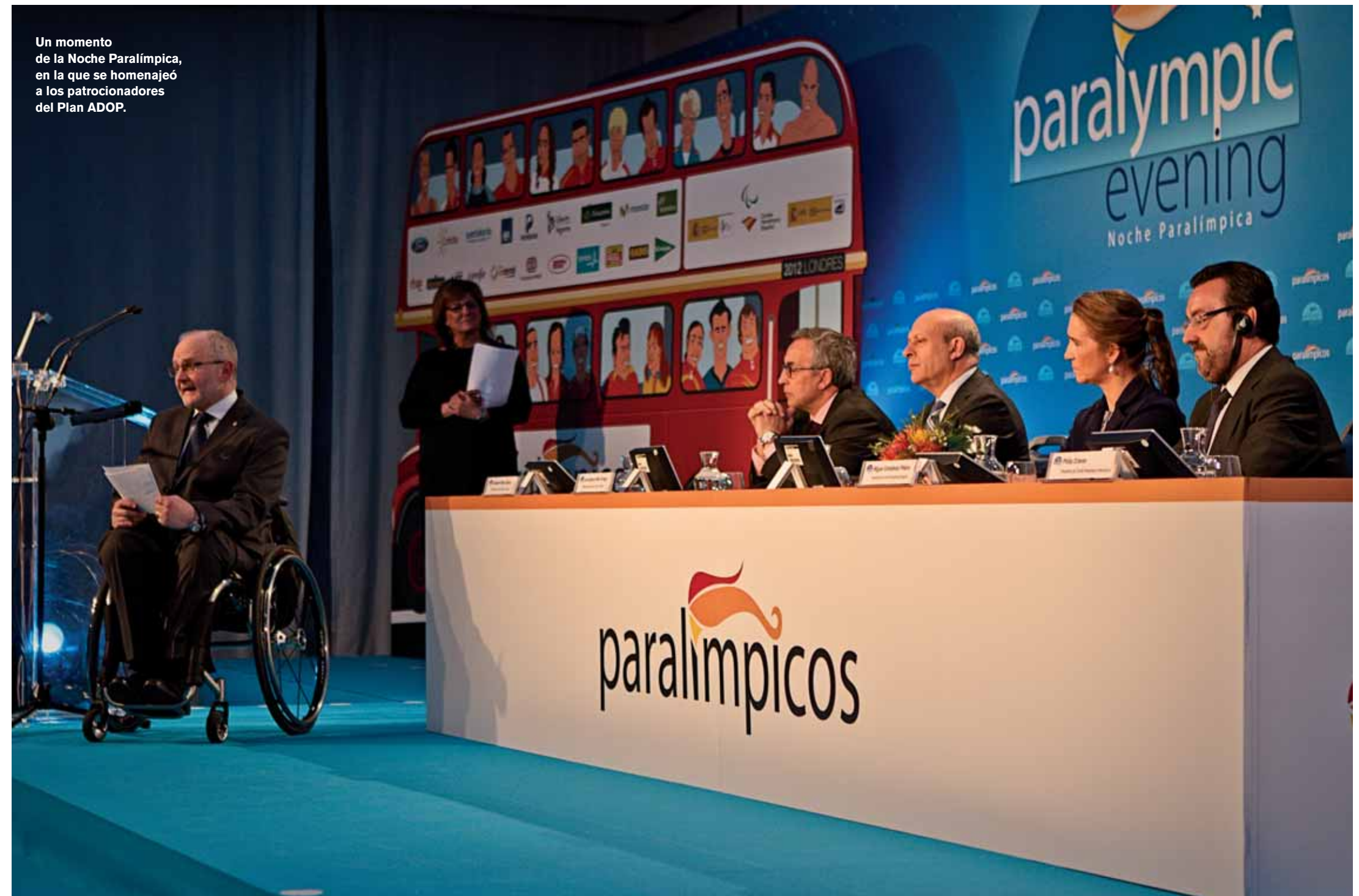
Un momento de la Noche Paralímpica, en la que se homenajeó a los patrocinadores del Plan ADOP.