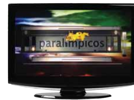
Nueva imagen del programa “Paralimpicos”, de TVE.

resúmenes diarios de los Mundiales de Natación, desde Holanda, y de Atletismo, desde Nueva Zelanda. La distribución de información a través de notas de prensa y fotografías sobre campeonatos nacionales e internacionales, con especial énfasis en el ámbito regional de cada deportista, y la difusión