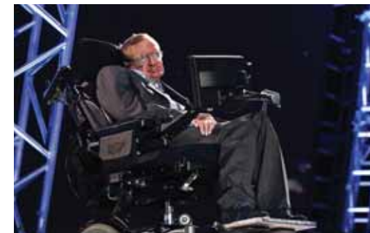
Stephen Hawking, protagonista de la ceremonia de inauguración de los Juegos Paralímpicos.

de competición, repartidas en tres grandes áreas: el Parque Olímpico, el Complejo Excel, el circuito de carreras de motor Brands Hatch (donde se desarrollaron las pruebas de ciclismo en carretera), Eton Dorney (para el remo) y Weymouth Bay y Portland Harbour (la vela). Las instalaciones no de-